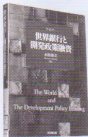
本間雅美 著 同文館出版 2008.3

筆者は2004年度にジョージタウン大学に留学の機会を得た。世銀本部ビルのドアを開けると、「我々の夢は貧困のない世界である」と刻まれた記念碑のプレートが目飛び込んでくる。本書は、世銀がグローバル化の挑戦に直面して生存理由が問われているなかで、政策改革の監督者としてではなく、国際公共財を貧困国に提供するパートナーとして、いかなる役割を果たすことが期待されているのかを探ることを強く意識して取りまとめたものである。留学中に、世銀の「構造調整融資」を「開発政策融資」に改名されたことと米国の新しい援助機関としてミレニアム・チャレンジ・アカウント(MCA)が設置さ