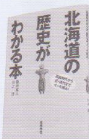
桑原真人 著 川上 淳 亜細亜社 2008.3

本書は、北海道に関する歴史を52のトピックスで紹介した。旧石器時代から江戸時代までを川上が、明治時代から現代までを桑原が担当している。これまでの多くの「北海道史」の本との違いは、通史的・教科書的な記述としなかった点である。トピックで構成し、それを読んでいくと、北海道の歴史がわかるように工夫した。