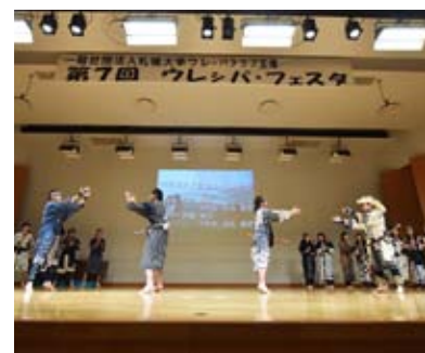
▲昨年のウレシパ・フェスタの様子